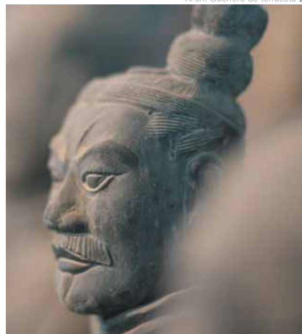
Xi'an: Guerrero de terracota