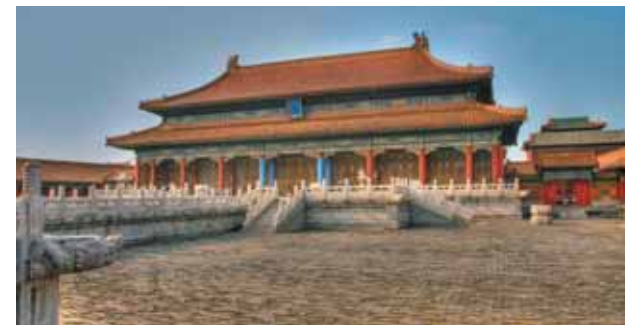
Beijing: Ciudad Prohibida

Tang Palace. Por la tarde, visita a la Mezquita Musulmana y paseo por el barrio. Cena amenizada con un espectáculo de la dinastía Tang. Alojamiento.