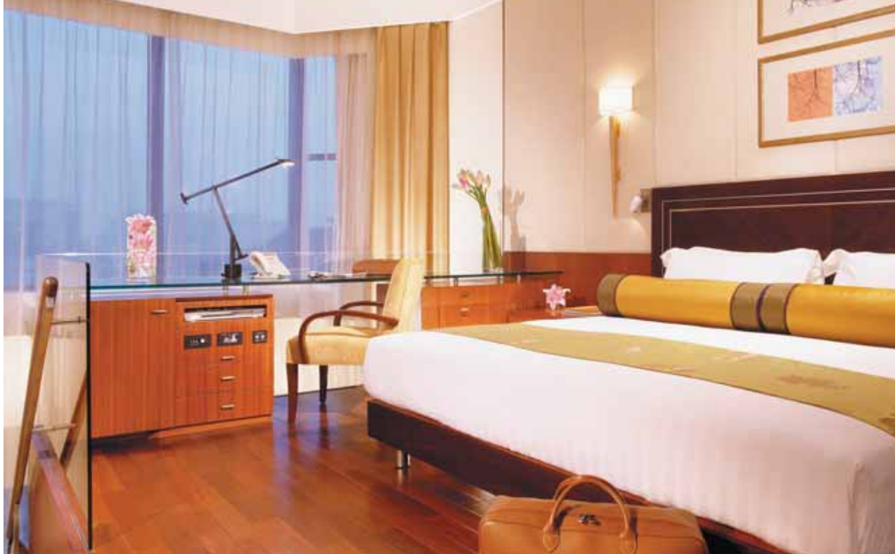
The Peninsula Beijing | Suite