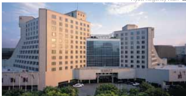
Hyatt Regency Xian