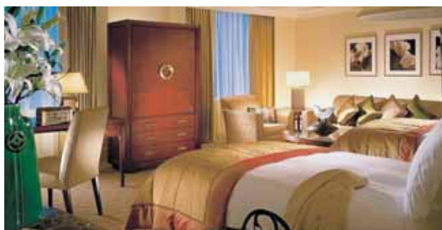
Four Seasons Hotel Shanghai | Deluxe Room

Billete de avión de Lufthansa en clase turista «W» > Salida Madrid y Barcelona > Billetes domésticos en clase turista Beijing / Xi'an / Shanghai > Traslados y visitas privadas según itinerario > Guías locales de habla hispana > Coche con aire acondicionado.