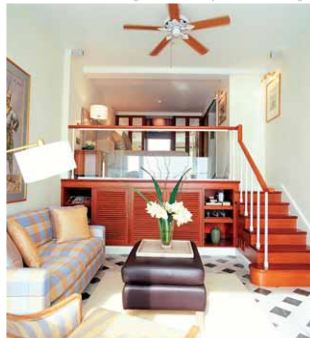
Bangkok: The Oriental | Deluxe Garden Wing

Día 13. España. Llegada y fin de nuestros servicios.