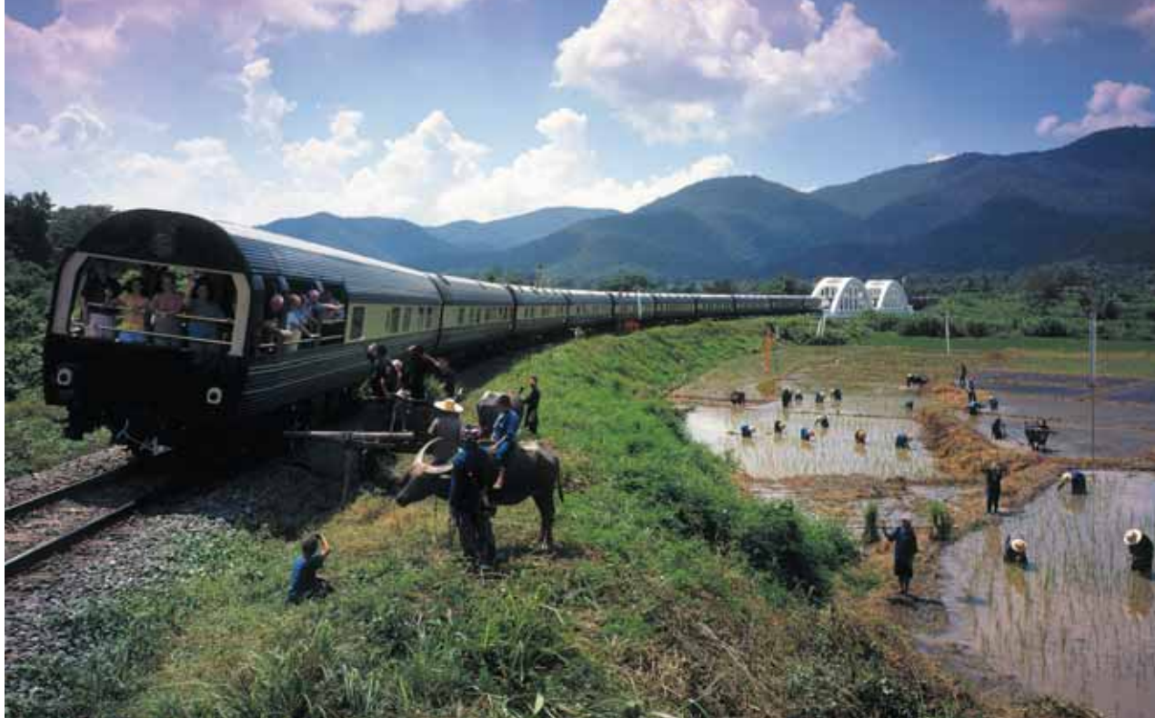
Eastern & Oriental Express