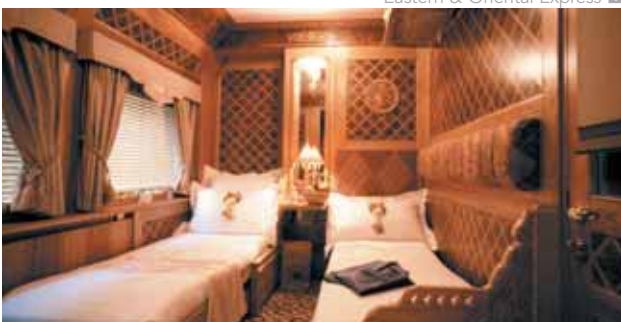
Eastern & Oriental Express

Día 8. Singapur. Desayuno. Visita medio día ciudad. Alojamiento.