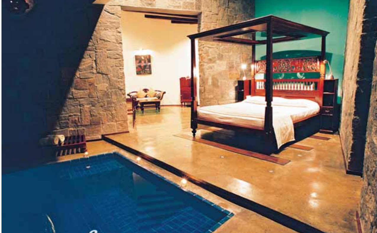
Sigiriya: Elephant Corridor Luxury Boutique Hotel | Romantic Suite with Pool