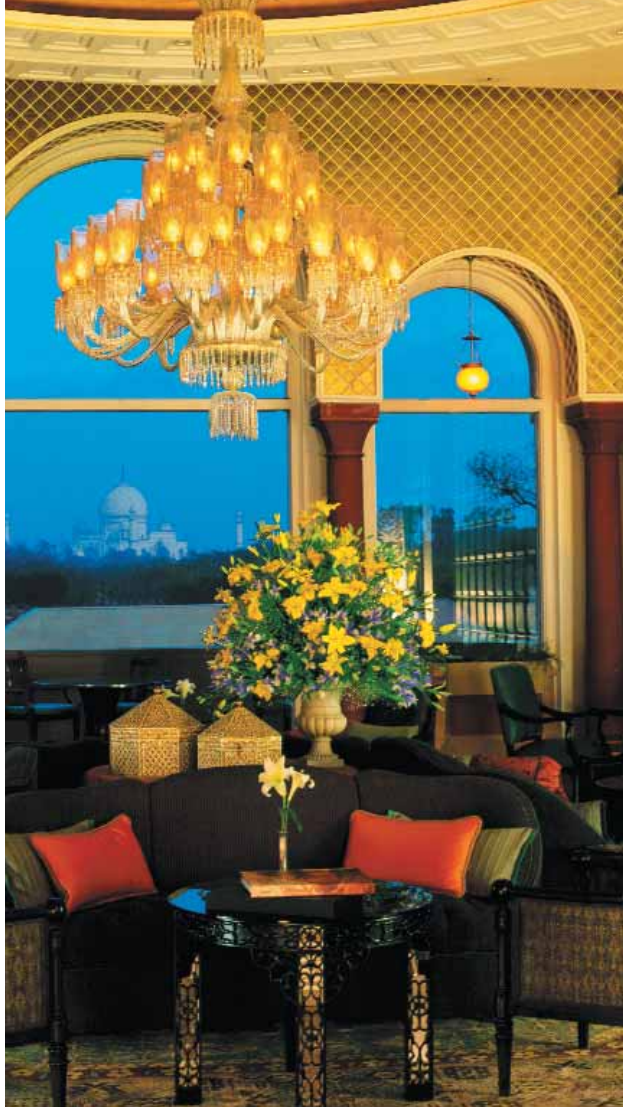
Agra: The Oberoi Amarvilas