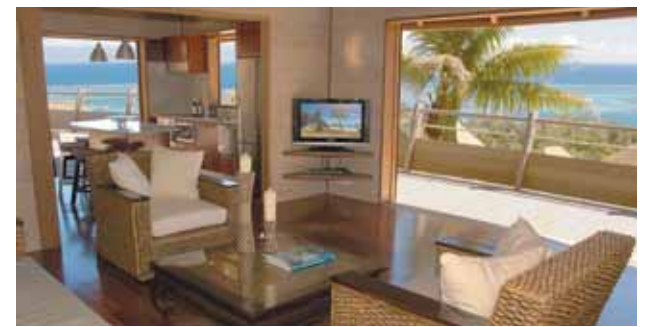
Moorea: Legends Resort