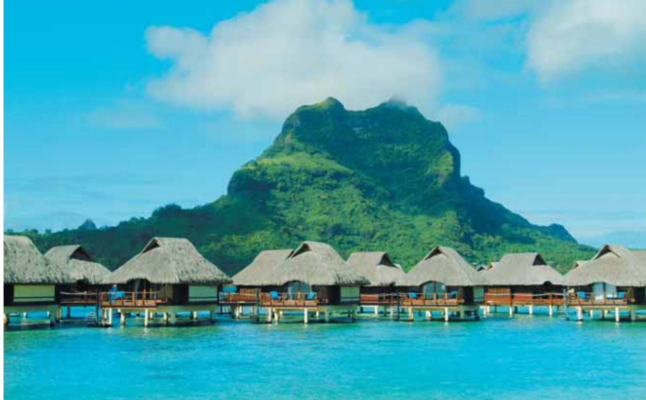
1 Bora Bora Lagoon Resort