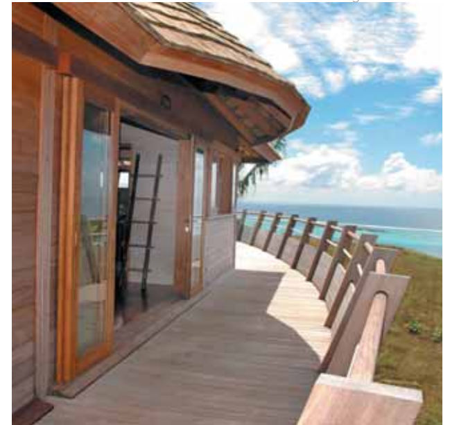
Moorea: Legends Resort