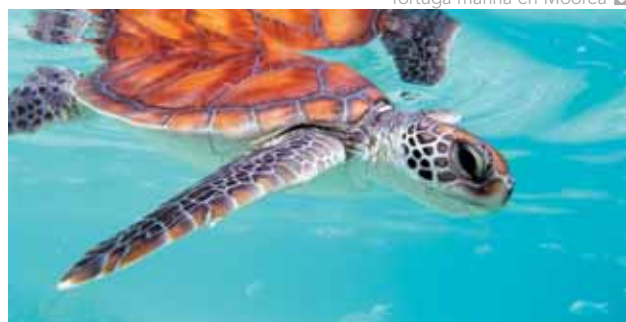
Tortuga marina en Moorea

Día 13. España. Llegada y fin de nuestros servicios.