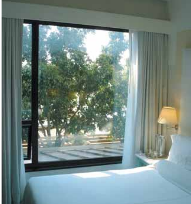
Los Ángeles: Mondrian

Día 1. España > San Francisco. Salida en vuelo con destino a San Francisco. Llegada y traslado hasta el hotel. Alojamiento.