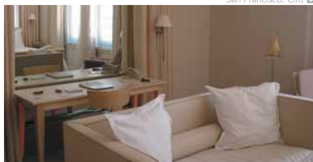
San Francisco: Clift