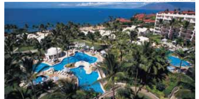
Maui: The Fairmont Kea Lani

SAN FRANCISCO > LAS VEGAS > LOS ÁNGELES > MAUI