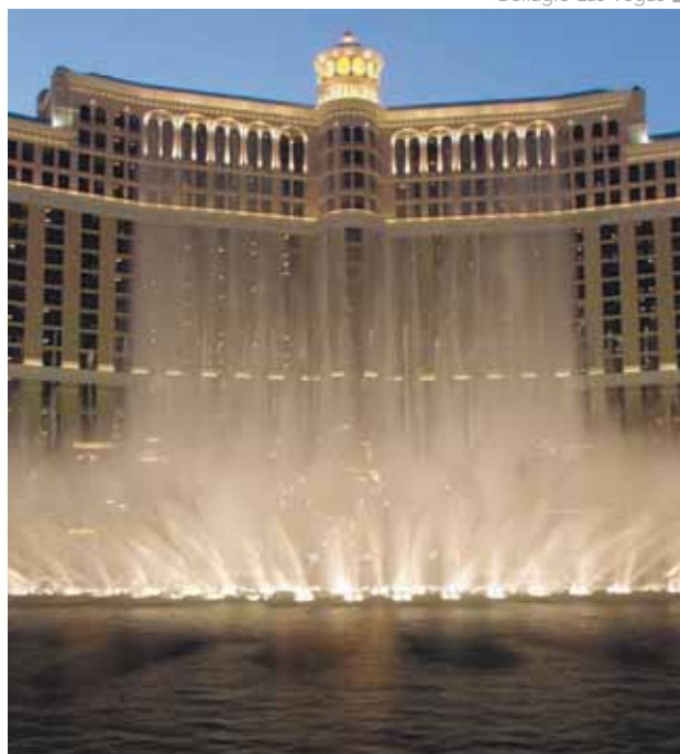
Bellagio Las Vegas