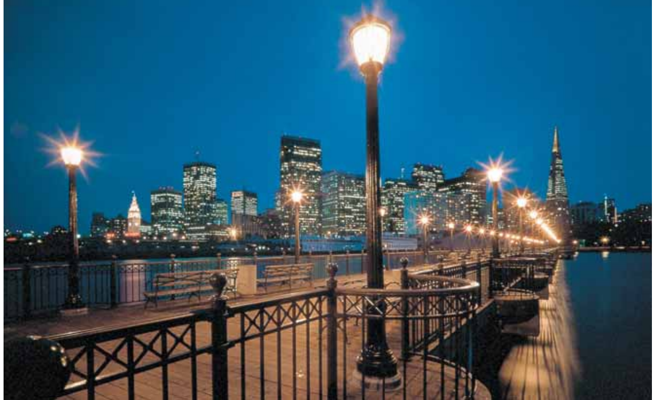
Bahía de San Francisco

Día 7. Los Ángeles. Visita de la ciudad de los Ángeles, que se inicia en el centro cívico, le sigue un recorrido por Hollywood Boulevard, con el famoso Paseo de las Estrellas, Teatro Chino, Sunset Boulevard, Beverly Hills y Rodeo Drive. Tarde libre. Alojamiento.