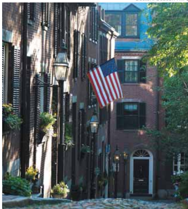
Boston: Beacon Hill

Billete de avión de Delta Airlines, clase turista «L» Estancia en los hoteles indicados en régimen de sólo alojamiento Traslados y visita ciudad en servicio privado.