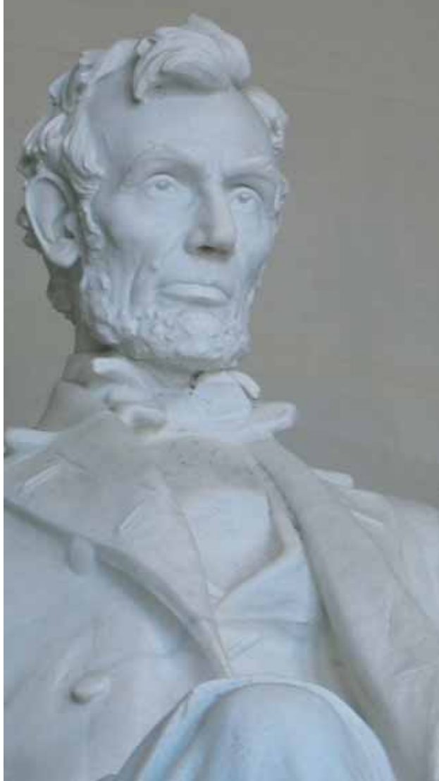
Washington Lincoln Memorial