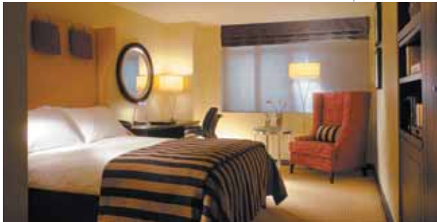
Boston: Nine Zero | Guestroom