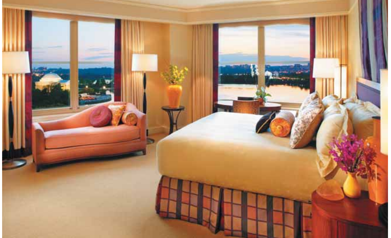
Mandarin Oriental Washington D.C. | Water Premier