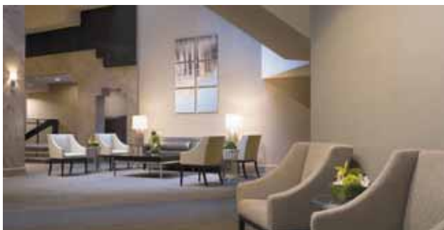
The Westin Washington D.C. City Center | Lobby