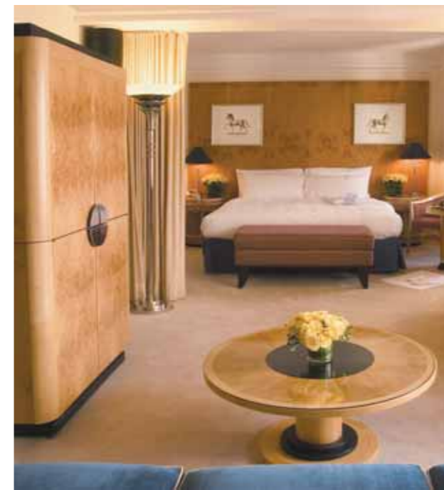
The New York Palace | Junior Suite

Mets y el complejo deportivo donde se celebra el famoso campeonato de tenis US OPEN y también las estructuras que quedaron de la Exposición Universal. También visitarán el encantador enclave de Forest Hills.