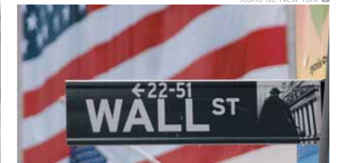
Icono de New York

Billete de avión de Delta Airlines en clase turista «U» ➡ Régimen de sólo alojamiento ➡ Traslados y visitas según itinerario, en servicio privado con chofer-guía de habla española.