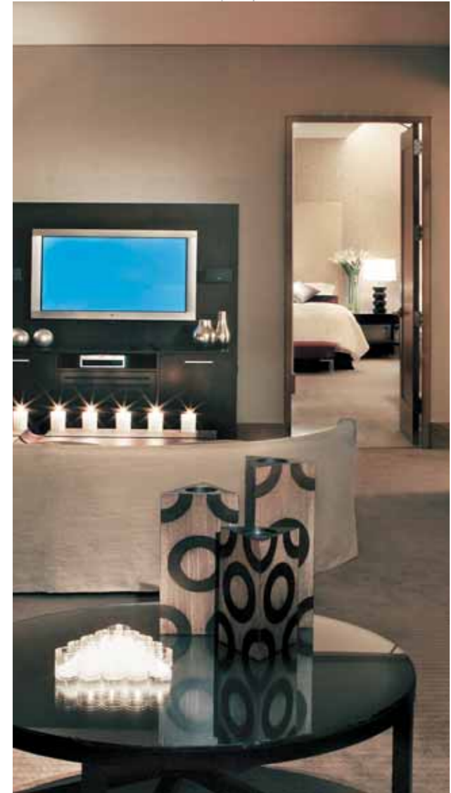
The Westin New York at Times Square | Presidential Suite

de Nueva York, el Macy's Herald Square (el centro comercial más grande del planeta) y la Quinta Avenida, un paraíso de las compras con las mejores tiendas (como Tiffany's) de los negocios más famosos del mundo en moda, joyas, perfumes, etc. La Quinta Avenida divide la zona en dos, el East y el West. Finalizaremos el recorrido bajando por la Museum Mile, junto al Central Park, donde están los museos más famosos: Guggenheim, Metropolitan y Frick Collection. También cruzaremos el parque por la zona Sur, para visitar el Lincoln Center, San Juan el Divino y la Universidad de Columbia. Tarde libre y alojamiento en el hotel.