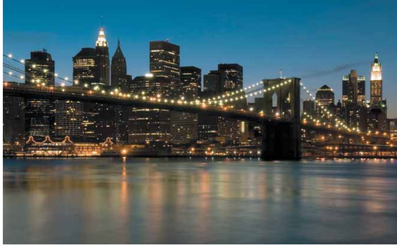
Puente de Brooklyn

Otras atracciones de esta parte de la ciudad, entre otras, son Broadway (el distrito de los teatros), el Madison Square Garden (situado en la calle 33, escenario de multitud de espectáculos y estadio de los New York Knicks), el Radio City Music Hall (entre la Sexta Avenida y la calle 50 West), la Biblioteca Pública