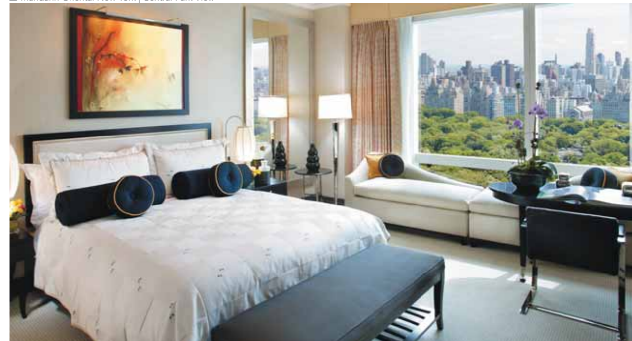
Mandarin Oriental New York | Central Park View

El tour pasará primero por la zona de Manhattan del Upper West Side, donde pararán en Lincoln Center y posteriormente pasarán frente al famoso edificio Dakota, donde vivió y murió John Lenon. Al llegar a Harlem podrán ver la zona de Sugar Hill, el enclave más encantador del barrio; visitarán la calle 125, donde posiblemente encontraremos a Franco, el famoso artista