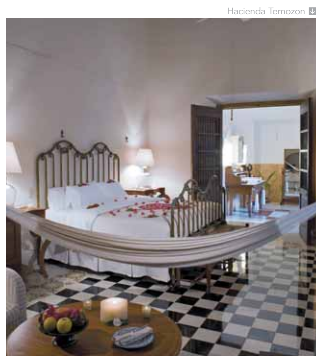
Hacienda Temozon >

Billete de avión de Aeromexico en clase turista «N» Salida desde Barcelona o Madrid (conexiones JK «W» o UX «K») Estancia en los hoteles mencionados, en régimen de alojamiento y desayuno Servicios de traslados y visitas en Mexico DF, en servicio privado 7 días de alquiler de coche Grupo H -modelo Dodge Attitude o similar (incluyendo km ilimitado y seguros CDW y LDW).