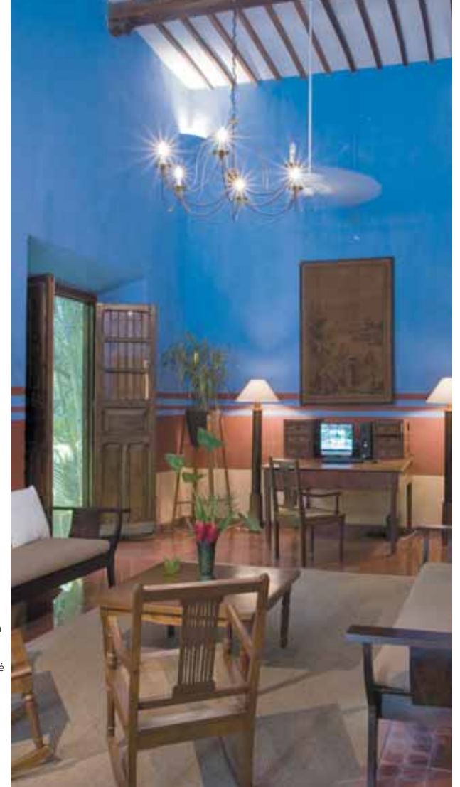
Hacienda San José Cholul