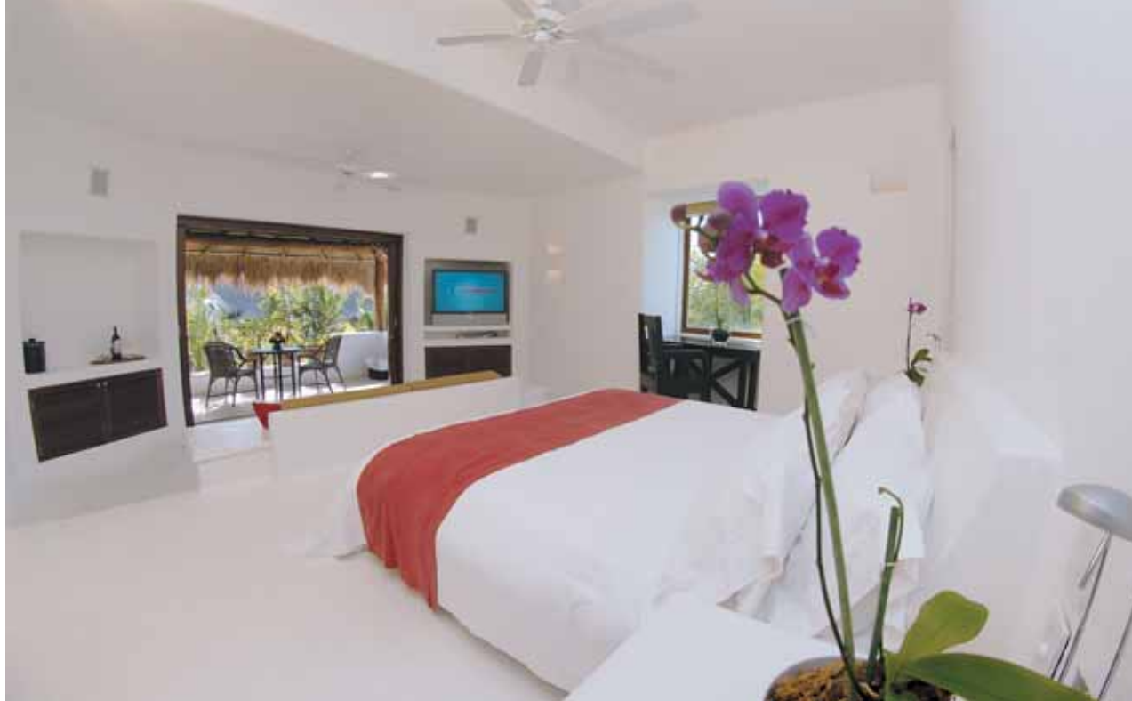
Esencia | Suite