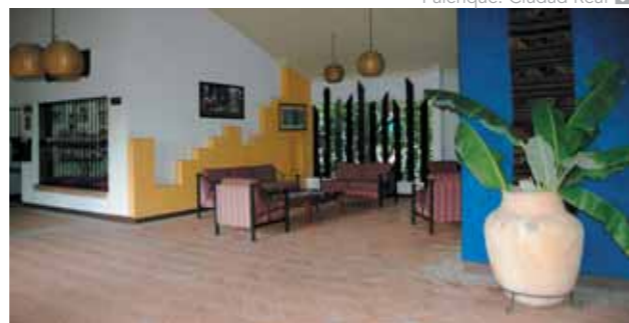
Palenque: Ciudad Real