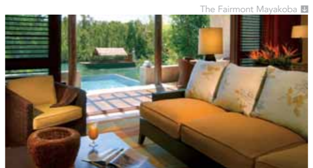
The Fairmont Mayakoba

La propiedad también ofrece un grupo de 90 casitas con dos a cuatro habitaciones cada una, completamente equipadas para su perfecto bienestar. Gran oferta en restauración (4 restaurantes y 4 bares).