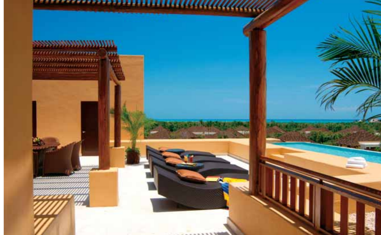
The Fairmont Mayakoba

INCLUYE Billete de avión de AeroMexico en clase turista «N» ➤ Salida desde Barcelona o Madrid (conexiones JK «W» o UX «K») ➤ Transporte en servicio privado según itinerario con estancia en los hoteles mencionados incluyendo desayunos ➤ 2 comidas (excursiones en Uxmal y Chichen Itza) ➤ Todos los servicios y visitas según itinerario ➤ Estancia de 3 noches Riviera Maya (hotel seleccionado).