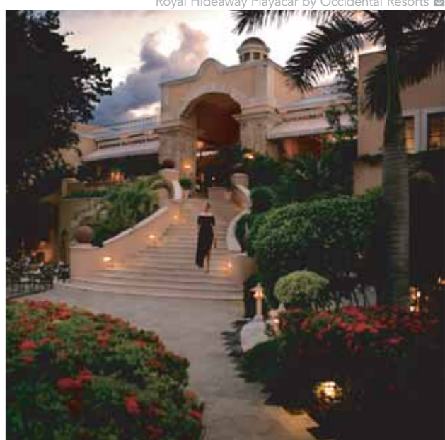
Royal Hideaway Playacar by Occidental Resorts

Localizado sobre una hermosa playa, a sólo 45 minutos del Aeropuerto Internacional de Cancún y a 5 minutos de la ciudad de Playa del Carmen, sobre 5 hectáreas de exuberante vegetación tropical. Representa la evolución del hotel «Todo Incluido». Arquitectura con fusión de estilos hispánico y colonial mexicano. Dispone de 6 restaurantes entre los que destaca «Las Ventanas» de Sergi Arola y 3 bares. 200 lujosas habitaciones decoradas con maderas nobles.