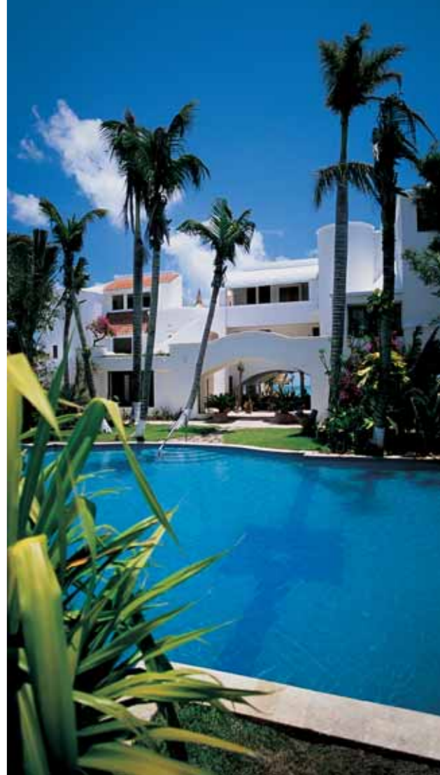
Maroma Resort & Spa

INCLUYE Estancia de 3 noches en regimen de alojamiento y desayuno en el hotel ➤ Habitación Garden ➤ Traslados en servicio privado desde y hasta el aeropuerto de Cancún.