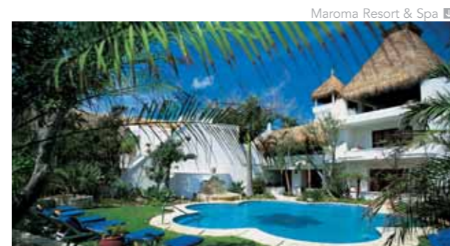
Maroma Resort & Spa

Las 58 habitaciones, decoradas con pinturas de artistas lugareños, están equipadas con camas king size cubiertas con sábanas de algodón tejidas a mano y mosquiteros, así como un cd player, pero sin televisión. Los huéspedes también pueden descansar en la hamaca de la terraza privada o en su tina. Hace poco el hotel inauguró el Kinan Spa, en el que tratamientos de pétalos de flores y hierbas curativas, masajes, baños de vapor, albercas watsu y yoga, se convierten en los redentores de cuerpo, mente y espíritu. Para complementar la estancia en el resort, los visitantes pueden degustar comidas saludables en el restaurante Cilantro o platillos internacionales y especialidades yucatecas.