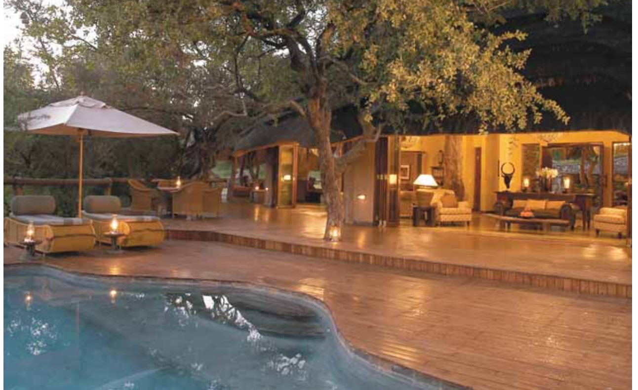
Tuningi Safari Lodge