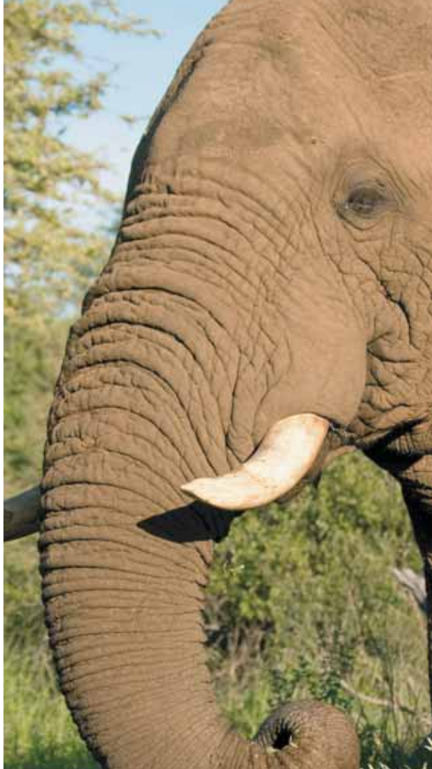
Elefante africano en Madikwe