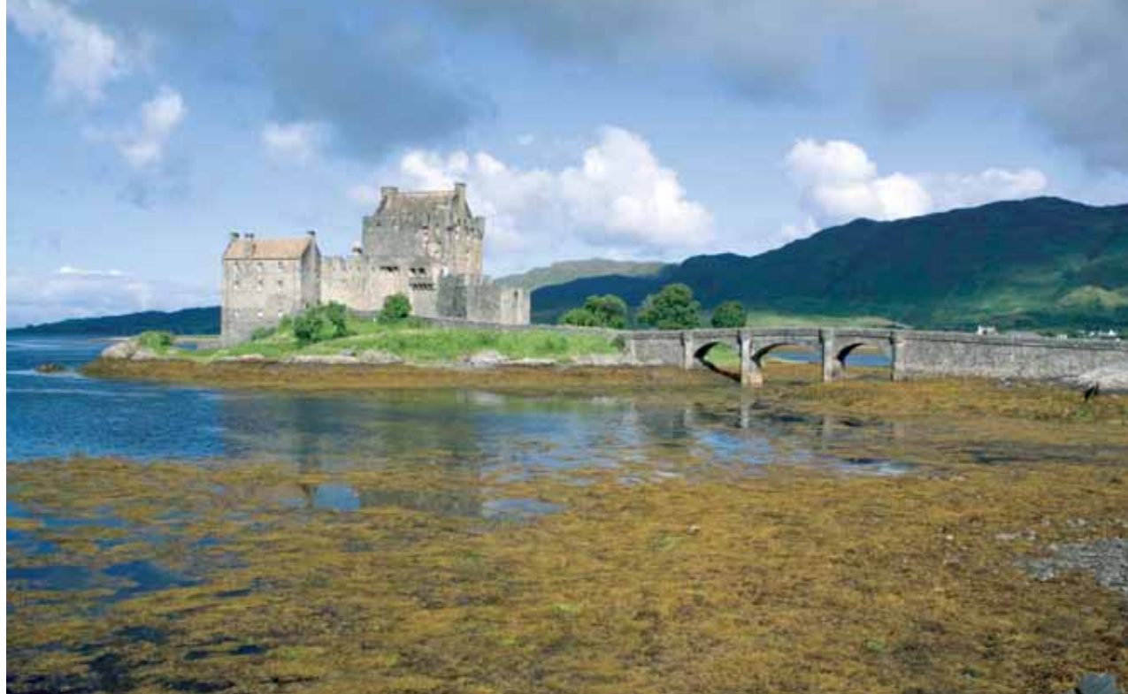
Eilean Donan Castle