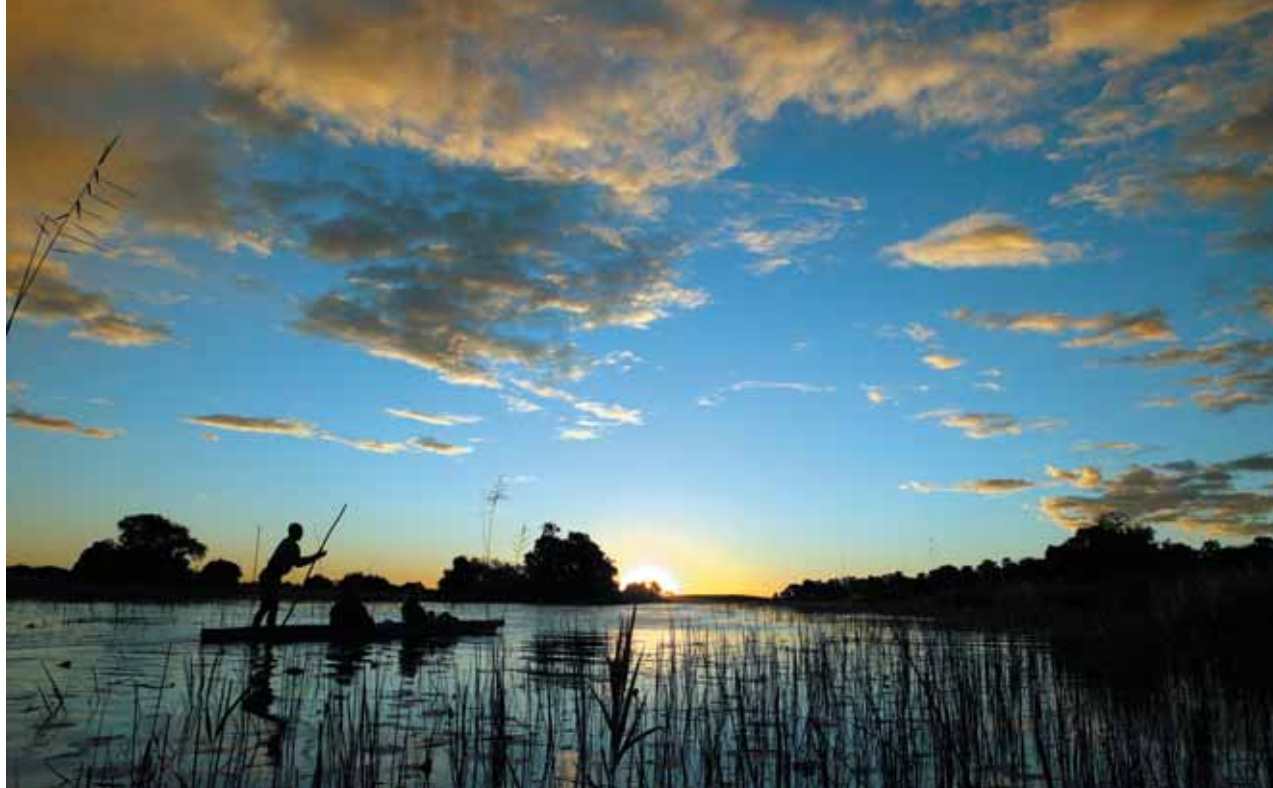
1 Delta del Okavango