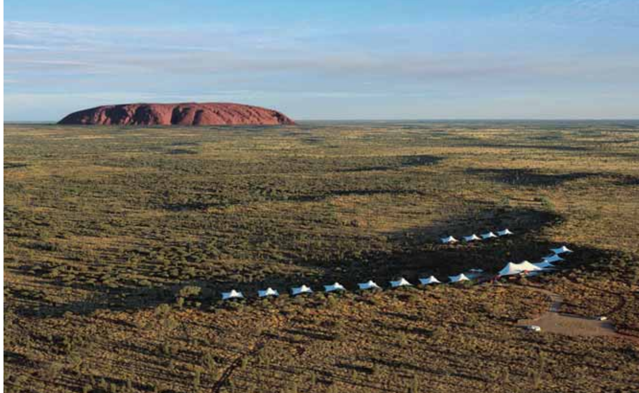
Ayers Rock: Longitude 131°

Día 1. España ➤ Sydney . Salida en vuelo con destino Sydney. Noche a bordo.