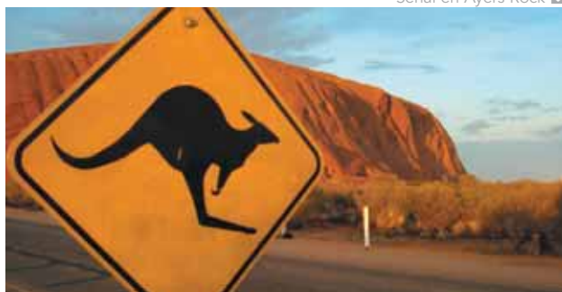
Señal en Ayers Rock