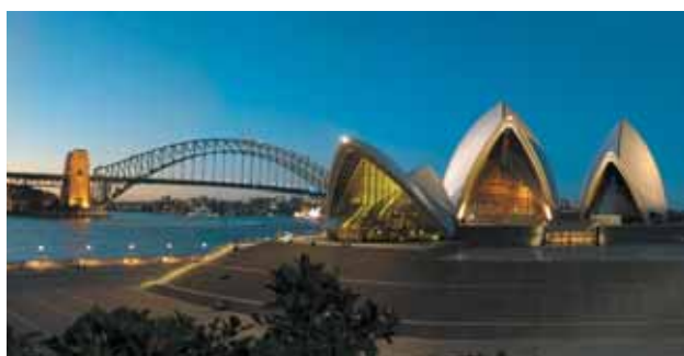
Sydney Opera House