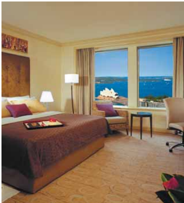
Shangri-La Hotel Sydney | Deluxe Opera House View Room