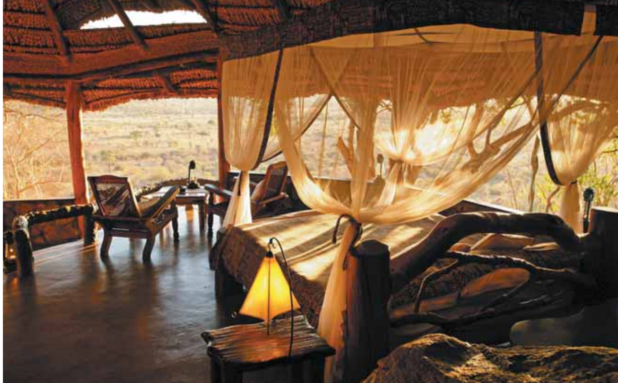
Meru: Elsa's Kopje