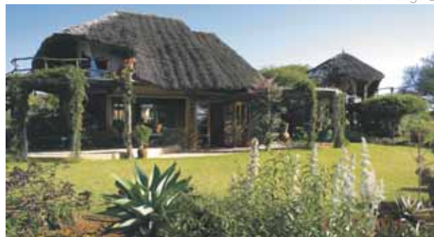
Loisaba: Loisaba Lodge

Día 12. España. Llegada y fin de nuestros servicios.