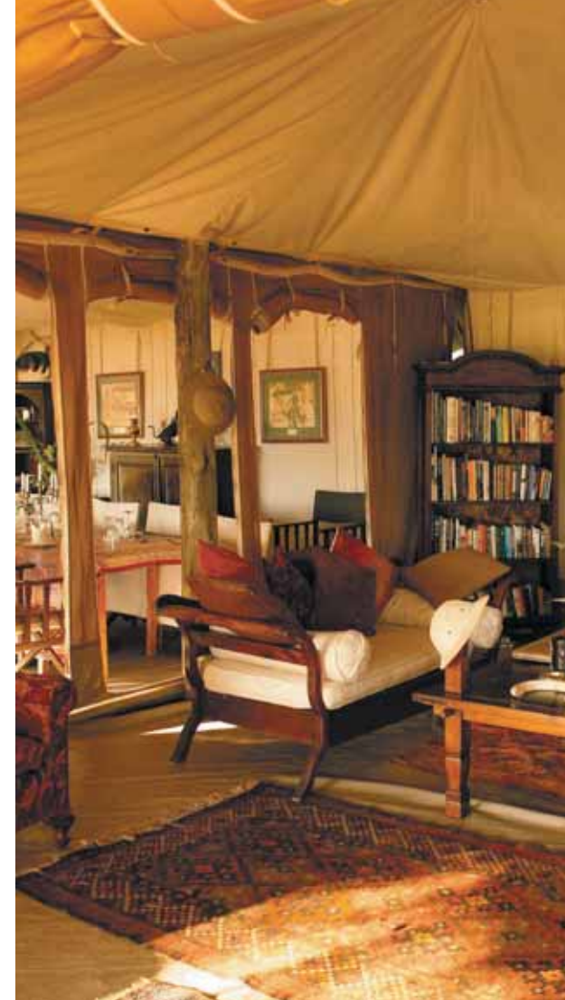
Maasai Mara: Cottar's 1920 Camp