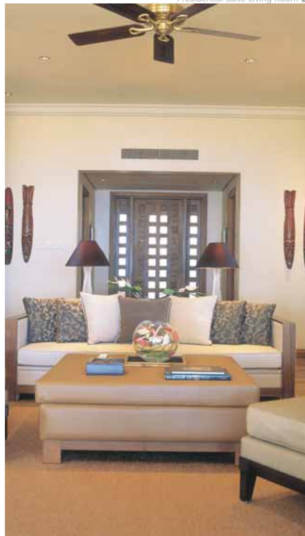
Presidential Suite Living Room