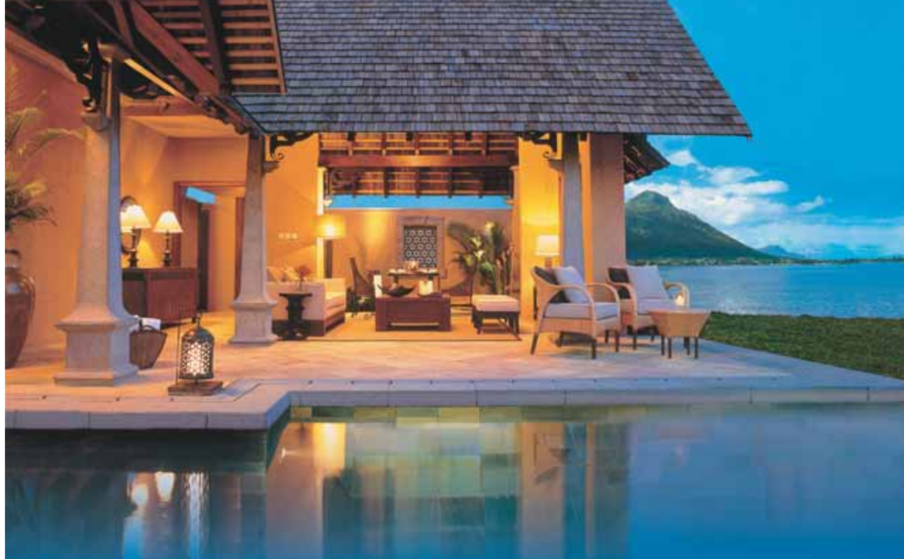
Luxury Villa with Pool