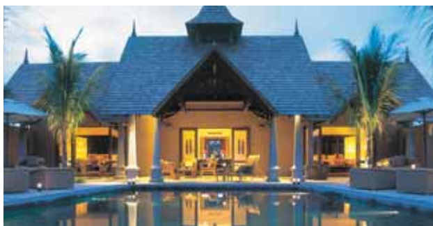
Presidential Suite with Pool

Este lujoso hotel está situado en Tamarind Bay (Flic en Flac) en la costa oeste de Mauricio a sólo 30 minutos de la capital Port Louis y a una hora del aeropuerto. Recomendado para los que buscan el máximo lujo y confort. Cuenta con 65 lujosas Villas privadas de 163 m2 decoradas con exquisito gusto, con su propia piscina, gran terraza-porche exterior con zona de comedor, servicio de mayordomo, DVD, TV de plasma, mini-bar, baño completo y ducha exterior. Cuenta con 2 restaurantes de cocina internacional, Taj Spa con tratamientos de Ayurveda, aromaterapia e hidroterapia, Golf de 18 hoyos, waterski, buceo, pesca de altura, snorkel, mini-club y gimnasio completo.