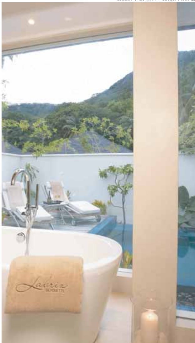
Beach Villa with Plunge Pool