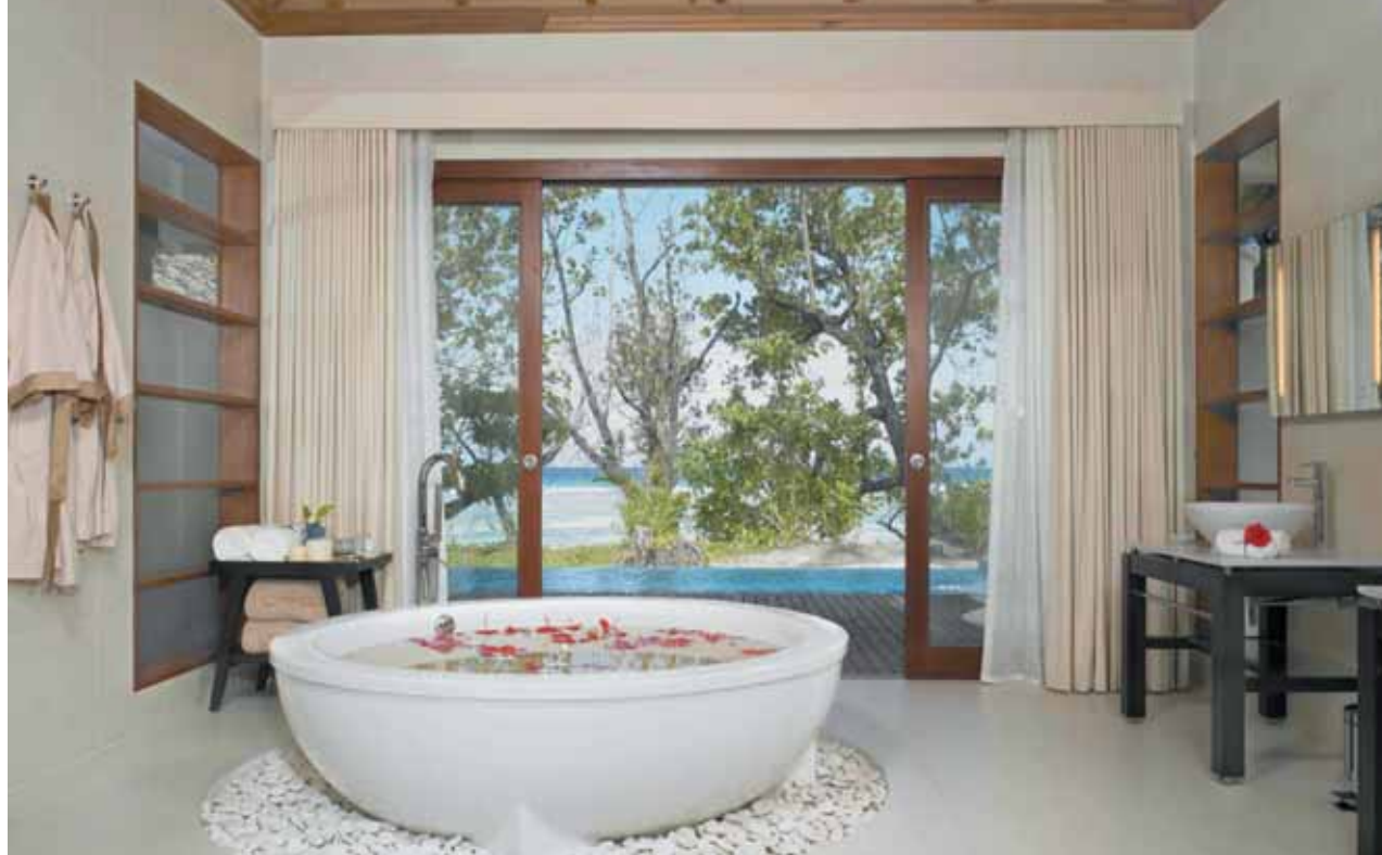
Pavilion Bath Room